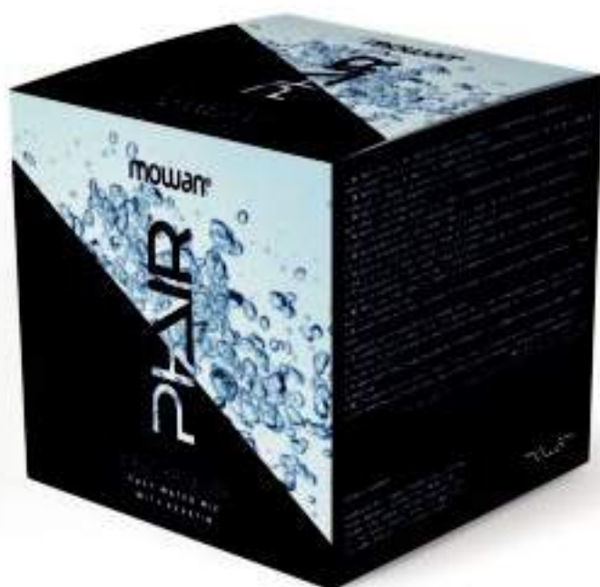
Phair Bleach Powder 2 x 500 gr

È sconsigliata la miscelazione della polvere decolorante Phair con acqua ossigenata, in questo caso il risultato standard determinato dall'azienda di produzione NON è garantito. Nel caso il colorista esperto volesse usare la polvere decolorante Phair con pigmento puro, con lo scopo di pigmentare o contro colorare; le proporzioni di miscela sono le seguenti: 1 parte di polvere decolorante e 1 parte di acqua di rubinetto. Il pigmento va aggiunto in quantità quanto basta, in base alla condizione di partenza dei capelli su cui applicare e in base al risultato che si vuol raggiungere.