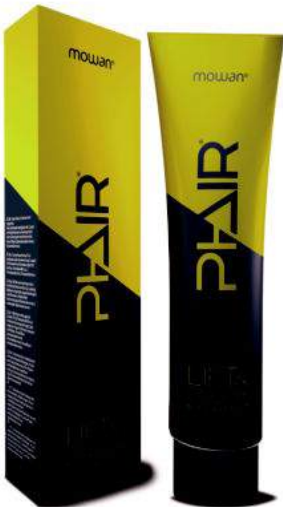
Phair Lift & Color 100 gr

Keratin is a protein present in hair structure that plays a key role in its health. A lack of keratin, in fact, involves a higher exposure of hair to external agents, making it weaker and more fragile. Natural keratin, used in Phair Lift & Color, protects and repairs hair fibre during bleaching and colouring process and makes dyed hair soft, tidy and shiny over time.