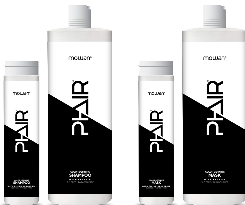
Phair Color Defining Shampoo 250 ml - 1000 ml

● Phair Color Defining Shampoo/Mask 250ml Les agents de lavage d'origine végétale nettoient délicatement les cheveux et le cuir chevelu. Sa formule est enrichie en Fision Keraveg-18, un complexe végétal composé par 18 acides aminés parmi lesquels protéines de blé et de soja. Ce complexe: Prolonge la vie de la couleur et empêche le discolouration / Protège contre les rayons UVA et UVB / Améliore l'hydratation, l'élasticité et le peignage des cheveux / Rend les cheveux brillants et soyeux. No SLS / No Parabens