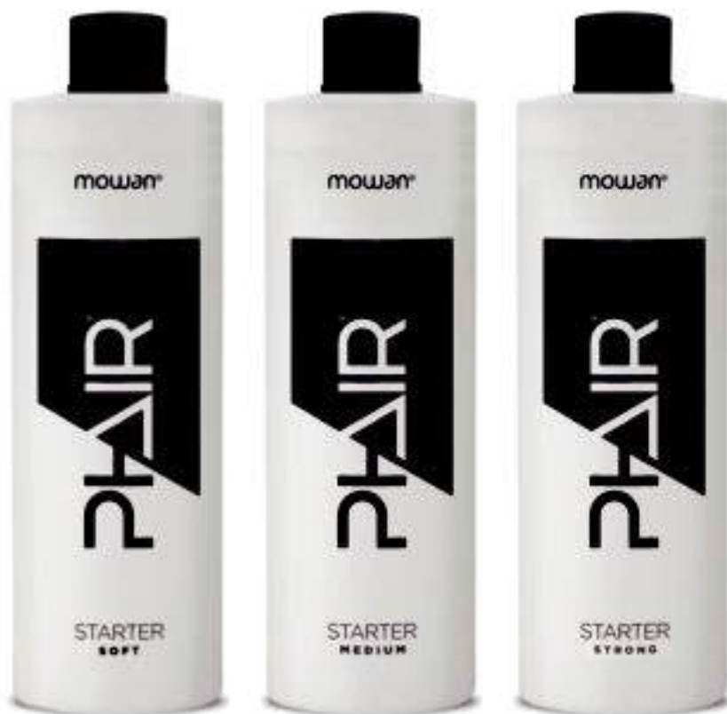
Phair Starter 1000 ml

Les starters Phair sont des agents qui développent les molécules de la couleur et décolorent les pigments, naturels ou artificiels, à l'intérieur des cheveux. Le starter détermine aussi le temps nécessaire aux cheveux pour se décolorer et se colorer. Starter Soft: idéale pour un changement de ton léger. Le starter soft, mélangé avec la crème Lift & Color, permet une décoloration graduelle et il est indiqué pour tenir sous contrôle la tonalité de la couleur désirée. Starter Medium: indiqué pour les décolorations rapides, il permet le développement des nuances des tonalités vives et intenses. Starter Strong: indiqué pour les décolorations fortes, le starter strong permet à la crème Lift & Color de décolorer jusqu'à 7 niveaux. Il est idéal pour les applications sur des nuances foncées.