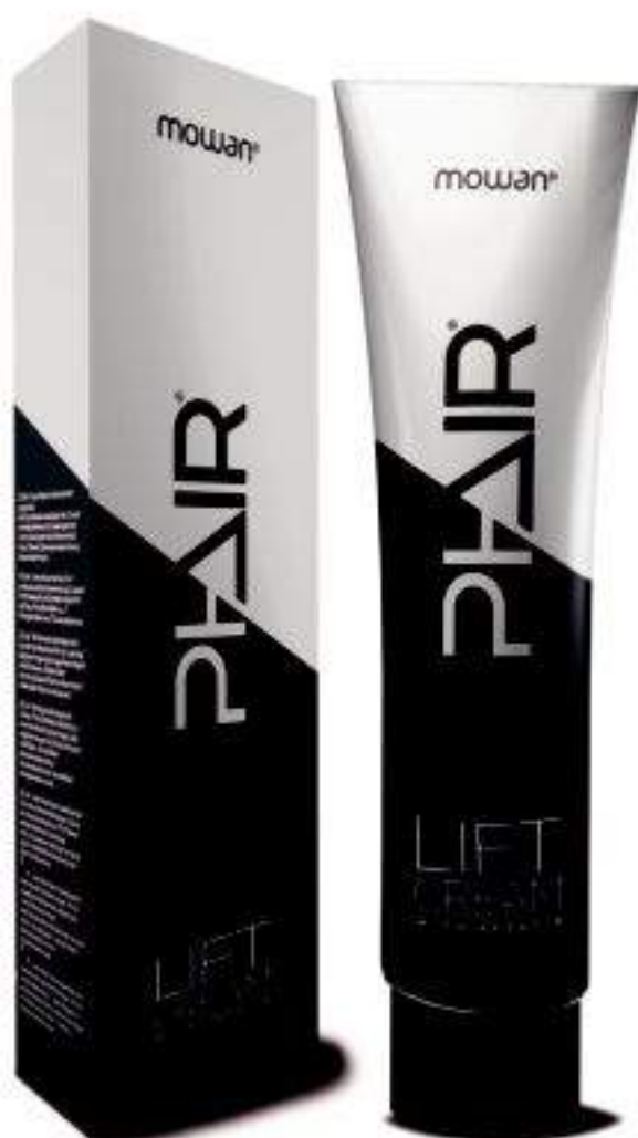
Phair Lift Cream 150 gr